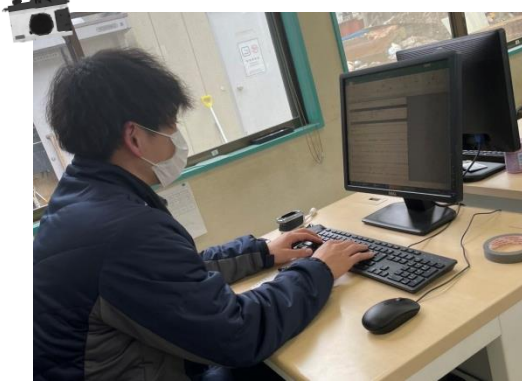
荒川産業株式会社 アマルク会津一ノ堰 営業